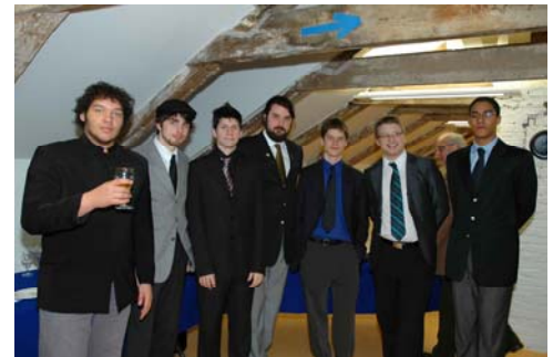
Membres actifs de la CFM 2008-2009